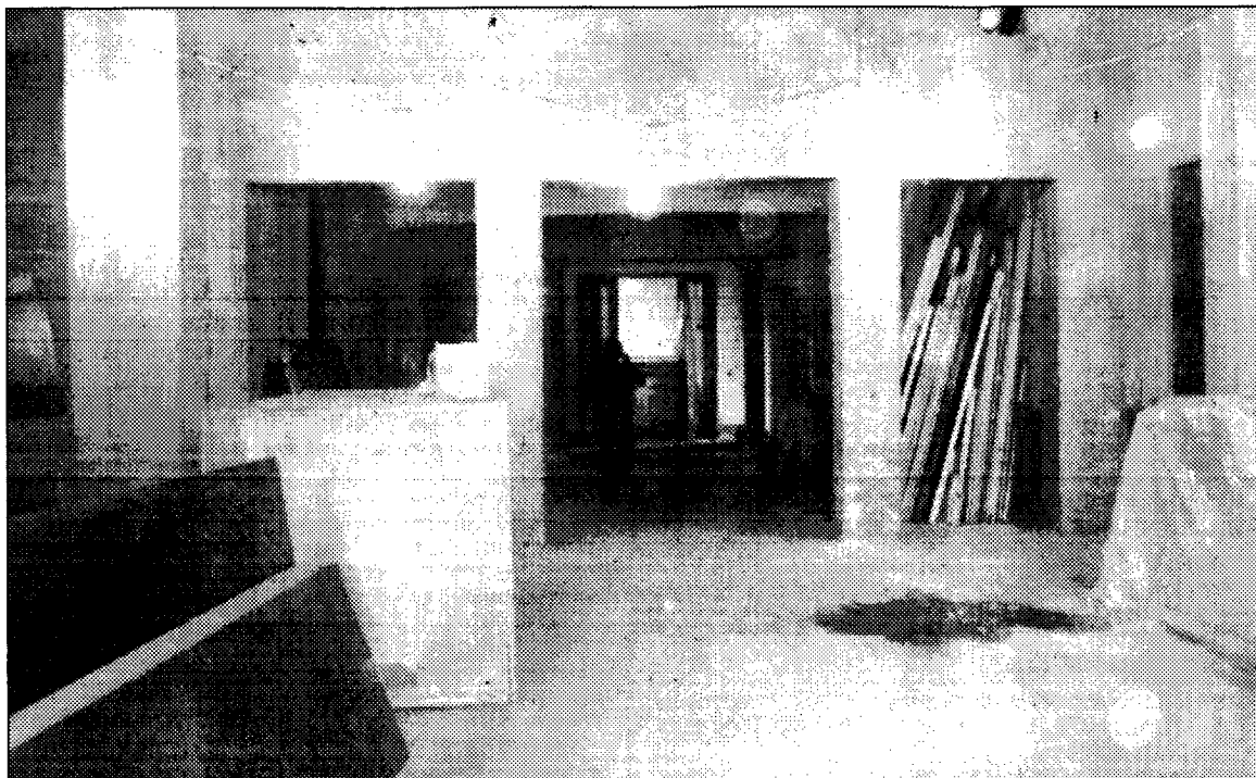
Lavori in corso all'interno della Villa Genoese Zerbi che ospiterà la "Zona d'Urgenza"